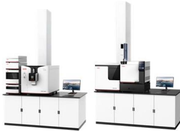
图 15 高分辨四极杆飞行时间质谱联用仪

EXPEC 7350 型 ICP-MS/MS、EXPEC 7910 型 ICP-QTOF 均实现了销售突破，在半导体高纯材料分析、高纯试剂检测、单颗粒分析等场景实现国产质谱的销售；面向生物样本的全自动样本前处理配套全自动 LC-MS/MS、面向环境新污染物和违禁品分析的在线 SPE-LC-MS/MS 等新品已成功上市，高端质谱仪器产品线得到了进一步补充。