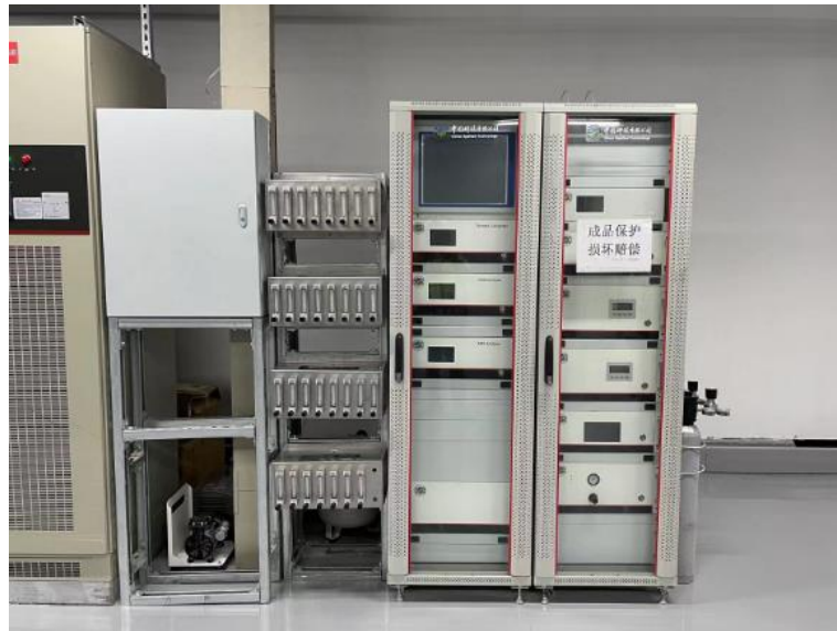
图 12 洁净空间 AMC-1000 微污染气体监测系统

面向湿化学品分析和洁净空间 AMC 微污染气体分析，FAAS 8000 杂质元素在线监测系统/在线阴阳离子检测系统产品已经在主流湿化学品制造企业进行入厂试验，AMC-1000 微污染气体监测系统（如图 12）在半导体行业客户投入使用，开展洁净车间制程环境中气相分子污染物的在线检测，实时检测各类气体的含量水平，满足客户对半导体生产现场各类型气相分子污染物的实时检测需求。洁净空间微污染气体监测系统 AMC-1000 系列采用先进的质谱、傅里叶红外、CRDS 光腔衰荡等方法，几乎可以监测半导体工业生产空间所有的气相分子污染物，气体成分无需制样，直接采样，自动进行全组分的定量分析，可以实现多点气体探测工作，最高可达 64 路气体切换。