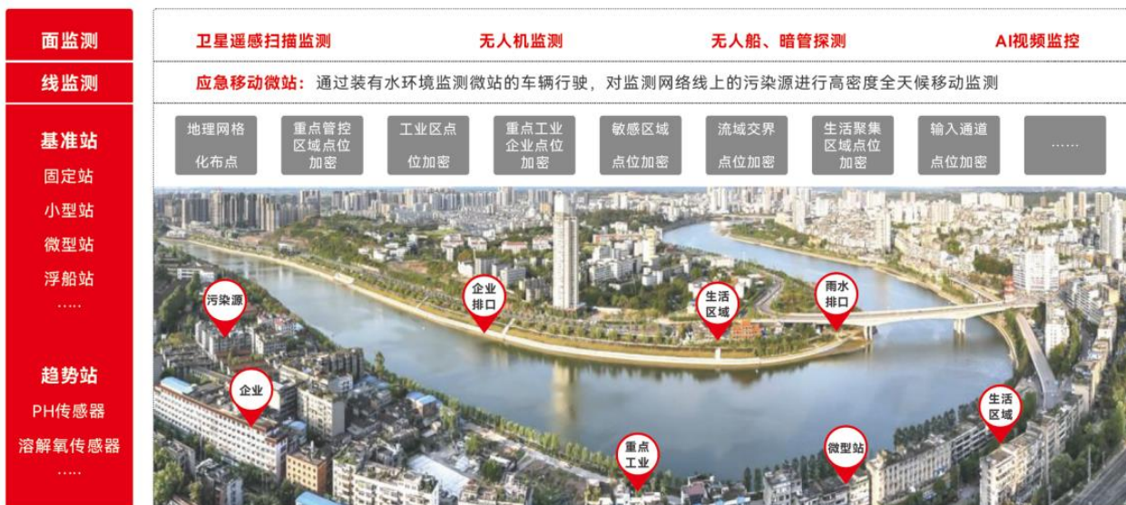
图 4 水环境监测解决方案

针对水体介质中违禁药物及其代谢物、抗生素、农残物等有机新污染物的检测，开发了实验室全自动水质 LC-MS/MS（SUPEC 5220 型在线 SPE-LC-MS/MS）和现场在线新污染物监测系统（SUPEC 5240 型现场在线 LC-MS/MS）两种设备，结合实验室 GC-MS 和车载、在线 GC-MS 形成了新污染物实验室和现场移动、在线等多场景方案，进行了持久性污染物、内分泌干扰物、抗生素等应用方法开发，已在示范用户处进行应用验证，可满足新污染物检测要求。