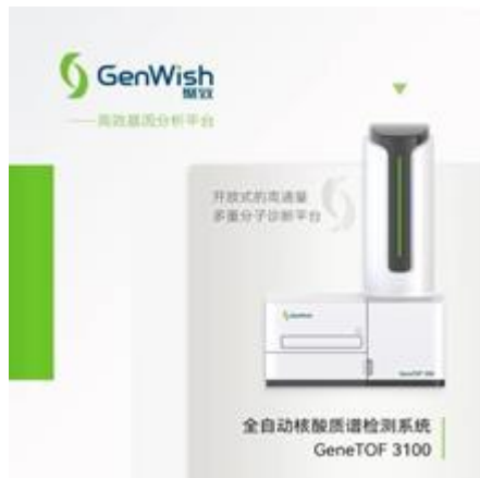
图 19 核酸质谱系统

公司的控股子公司杭州聚致生物科技有限公司专注于生物质谱类仪器产品的研发、生产和推广，目前主要的产品为核酸质谱系统（如图 19）。核酸质谱是以 MALDI-TOF 技术平台为基础的专用于核酸分析的高通量、高精度、高分辨的质谱系统，在疾病诊断、农业育种、检验检疫等领域具有广阔的应用前景，是未来分子诊断发展的新兴方向之一。该产品 2022 年推出，截止目前已经同多家分子诊断领域专业企业建立了实质性的合作关系，共同建设产业生态。