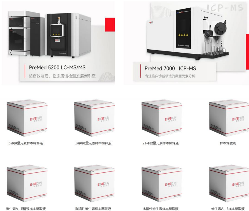
图 17 临床质谱相关产品

生命科学是研究生命现象、生命活动的本质、特征和发生、发展规律的科学，从人类基因组计划到现在，细胞、基因、蛋白、代谢分子等各种生命组织奥秘解释都依赖于高端分析仪器的发展。质谱、色谱、光谱等分析技术在支持生命科学的发展上做出了巨大贡献，受到了越来越多的重视。公司针对临床研究、疾病的早期诊断与疾病动态发展研究需求，成立了谱聚医疗、谱康医学、聚拓生物、聚致生物几个业务单元，面向临床诊断、细胞分析、蛋白分析、核酸分析等应用场景开展业务。