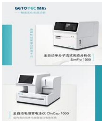
图 20 全自动毛细管电泳仪和单分子流式免疫分析仪产品