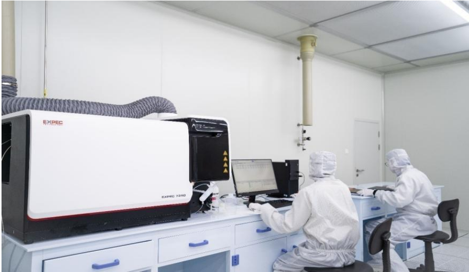
图 11 EXPEC 7350 三重四极杆 ICP-MS

痕量杂质元素分析是集成电路生产过程极重要的质量控制手段，在硅片加工、电子级湿化学品/高纯特气生产、晶圆制造乃至集成电路生产车间环境保障等方面，ICP-MS/MS 都在其中的痕量杂质元素检测中发挥着主要作用。今年以来，EXPEC 7350 三重四极杆电感耦合等离子体质谱（ICP-MS）已在中电化合物半导体等上游供应商产生销售（如图 11），在硅基和化合物半导体领域实现了销售和产品交付，并已陆续在国内主要芯片制造企业开展前期验证工作，逐步进入集成电路制造主要领域。