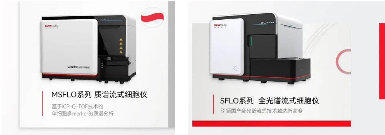
图 18 流式细胞分析产品

公司的控股子公司杭州聚致生物科技有限公司专注于生物质谱类仪器产品的研发、生产和推广，目前主要的产品为核酸质谱系统（如图 19）。核酸质谱是以 MALDI-TOF 技术平台为基础的专用于核酸分析的高通量、高精度、高分辨的质谱系统，在疾病诊断、农业育种、检验检疫等领域具有广阔的应用前景，是未来分子诊断发展的新兴方向之一。该产品 2022 年推出，截止目前已经同多家分子诊断领域专业企业建立了实质性的合作关系，共同建设产业生态。