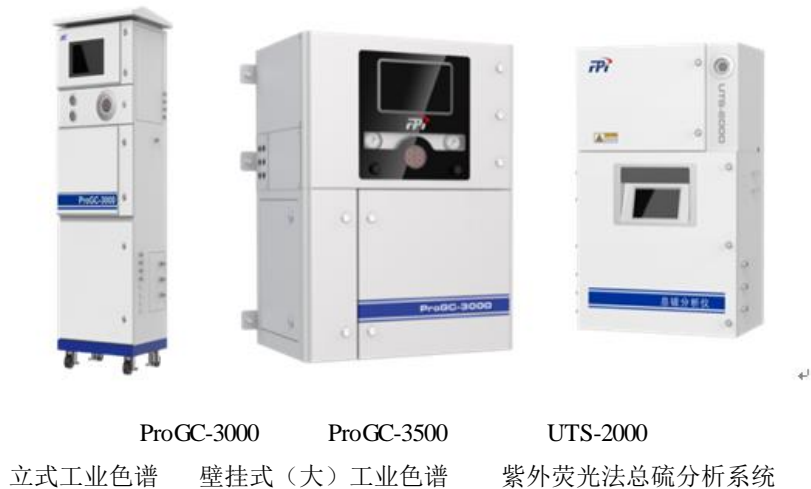
图 8 工业在线色谱产品

接安装的立式工业在线色谱和分析小屋内安装的壁挂式工业在线色谱两种大类，开发了防爆 TCD、FID、FPD 等系列化的色谱检测器和关键部件，可以满足绝大多数的工业应用场景。开发了甲烷转化器，使业务可以拓展到 ppb 级别的 CO 和 CO 2 检测市场；推出了液体汽化阀，可以使工业在线色谱具备液体样品的在线测量功能；研制了色谱填充柱，提高了工业在线色谱业务的自主可控性。