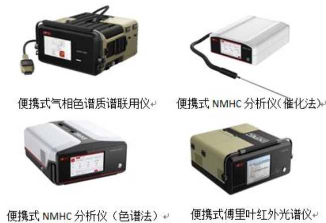
图 3 新型便携式分析仪器

针对现场监测的“更准确，更灵敏，更快速，更轻便”的新需求，不断进行技术创新，推出了新型便携式气相色谱质谱联用仪、手持式总烃分析仪、便携式 NMHC 分析仪、新型便携式傅里叶红外光谱仪等一批新产品，已实现批量生产交付。