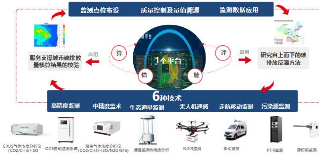
图 6 数智双碳综合管控解决方案

自主研发的环境空气 ODS 自动监测系统和高精度温室气体自动监测仪等高端碳监测设备，在部分试点城市实现了业务化稳定运行，助力各地高精度温室气体监测网建设。基于现有技术平台探索更多温室气体监测的方法和碳数据分析应用模式，结合碳监测智慧监管平台，通过立体监测数据整合和大数据分析，增强碳达峰预测准确性，大幅度提升碳精细化管理水平和靶向治理能力，为政府主管部门制定中长期的碳减排目标提供科学依据。