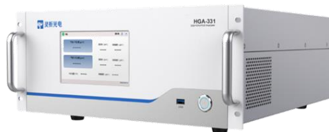
图 7 高精度温室气体分析仪

旗下子公司灵析光电聚焦于高精度激光分析仪的研制与产业化，目前开发的高精度温室气体分析仪，可以同时在线监测 CO 2 /CH 4 /CO/H 2 O 等多组分气体，该产品基于先进的光腔衰荡光谱法（CRDS），精度可达 ppb-ppt 级别，满足超高灵敏度、超高精度、超高稳定性的温室气体在线分析需求。产品 HGA-331（如图 7 所示）已经到环保、气象等多家单位进行现场测试，性能指标达到国际领先水平，优于 WMO 网络兼容性目标的 1/2，打破了国外公司同类产品对国内市场的垄断。目前产品已经完成了批量销售和交付。