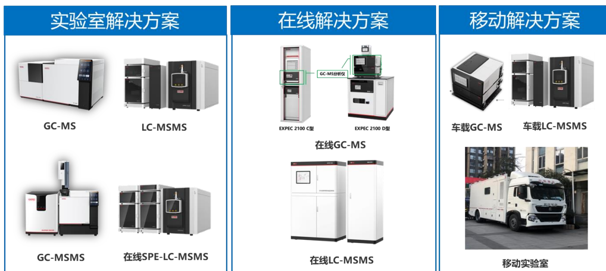
图 5 新污染物监测整体解决方案

针对水体介质中违禁药物及其代谢物、抗生素、农残物等有机新污染物的检测，开发了实验室全自动水质 LC-MS/MS（SUPEC 5220 型在线 SPE-LC-MS/MS）和现场在线新污染物监测系统（SUPEC 5240 型现场在线 LC-MS/MS）两种设备，结合实验室 GC-MS 和车载、在线 GC-MS 形成了新污染物实验室和现场移动、在线等多场景方案，进行了持久性污染物、内分泌干扰物、抗生素等应用方法开发，已在示范用户处进行应用验证，可满足新污染物检测要求。