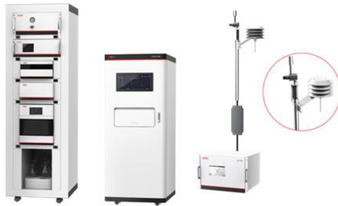
图 2 空气 OVOCs 自动监测系统、臭氧生成速率分析仪、黑炭分析仪

针对现场监测的“更准确，更灵敏，更快速，更轻便”的新需求，不断进行技术创新，推出了新型便携式气相色谱质谱联用仪、手持式总烃分析仪、便携式 NMHC 分析仪、新型便携式傅里叶红外光谱仪等一批新产品，已实现批量生产交付。