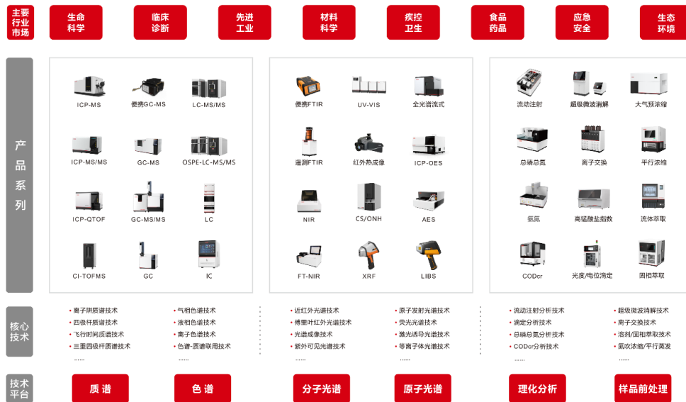
图 14 高端科学仪器产品或技术平台

本报告期，公司继续深入秉持“自主研发、持续创新、深度定制”的创新发展模式，旗下子公司谱育科技持续加大研发投入，完成了多个产品的技术攻关，推出了四极杆飞行时间高分辨质谱、便携式四极杆气质联用仪等多个新产品，高端质谱产品客户认可度持续提升，保持了在行业内技术与市场“双引领”的高质量发展。公司不断积累质谱、光谱、色谱、生物、样品前处理、理化分析等新型技术平台（如图 14），加速创新研制技术先进、填补空白的实验室高端分析仪器，打破国外垄断、突破技术瓶颈、实现国产替代。