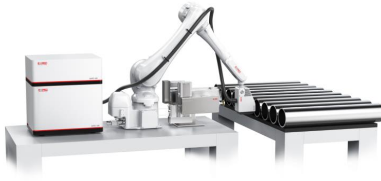
图9 钢材智能在线实时分析系统（在线 LIBS 系统）

智能检测装备作为智能制造的核心装备是“工业六基”的重要组成部分和产业基础高级化的重要领域，已成为稳定生产运行、保障产品质量、提升制造效率、确保服役安全的核心手段，对加快制造业高端化、智能化、绿色化发展，提升产业链供应链韧性和安全水平，支撑制造强国、质量强国和数字中国建设具有重要意义。围绕工业过程成分分析的智能化建设目标，以实验室分析光谱、质谱、色谱、电化学分析技术平台为基础，结合自动化样品处理、流体自动控制技术，研制了工业过程成分智能在线分析系统（如图 10），为智能工厂建设提供技术支撑。针对稀土、新能源、有色金属冶炼、半导体等行业应用，开展分析方法研究，实现工业自动化分析，信息化管控的融合，为工业过程成分质量控制提供智能检测装备。2023 年，全面升级系统核心部件及算法，实现了一拖多模式的多点采样、高低浓度样品独立传输控制、防爆采样设计、样品过滤反洗模块设计及系统主机单元一体化设计，实现了工业过程成分智能在线分析系统 2.0 版本，结合更多应用场景需求设计，实现过程成分智能分析。