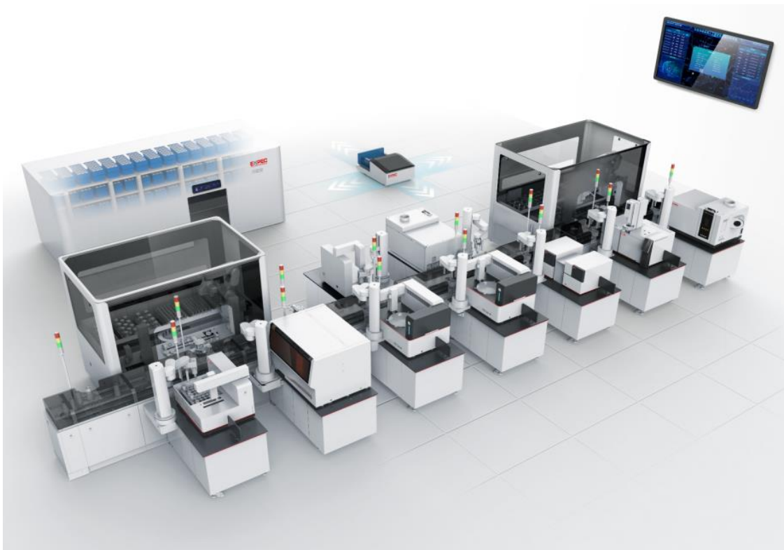
图 16 AI 人工智能实验室

AI 人工智能实验室（如图 16）由全自动水质分析仪器、全自动水质流水线、智能控制及信息管理系统组成，可开展高锰酸盐指数、氨氮、总磷、总氮等国家采测分离“9+X”项目的监测分析。系统预留开放式端口，兼容匹配多种全自动水质分析仪，并支持多种水质指标监测自由组合，后期有望实现重金属等多指标水质监测分析。AI 人工智能实验室构建以智能化为核心的监测技术与监测管理体系，致力于成为数字化实践标杆项目，实现“智能化、数字化、标准化”的数智赋能，有助于探索更创新、更具代表性的数字化转型路径。系统已在国内多个城市安装运行，实现实验室检测“采样-运输-仓储-检测-分析”全流程自动化，提高生产效率。