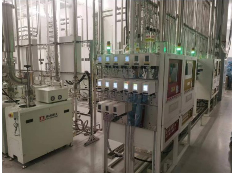
图 13 GDM 系列特气报警仪产品